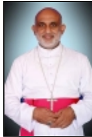
മാർ റാഫേൽ തട്ടിൽ മെത്രാഭിഷേകം : 10-4-2010